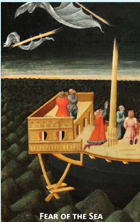
FEAR OF THE SEA IN THE HISTORY OF THE MEDITERRANEAN